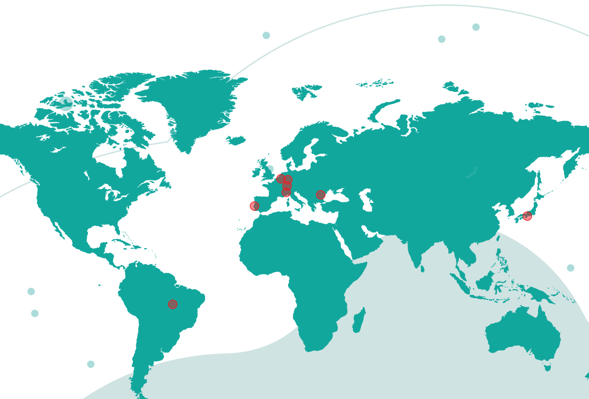
Figura 2 – Distribuição geográfica de alunos-atletas deslocalizados do Programa UAARE no ano letivo 2021/2022

A nível internacional, os alunos-atletas deslocalizados estão distribuídos por vários países na Europa, América do Sul e Ásia.